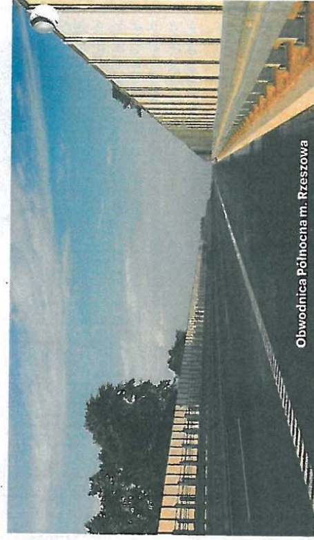
Obwodnica Północna m. Rzeszowa

Projekt współfinansowany przez Szwajcarię w ramach szwajcarskiego programu współpracy z nowymi krajami członkowskimi Unii Europejskiej. Informacje o Programie dostępne są na stronie: http://www.programszwajcarski.gov.pl